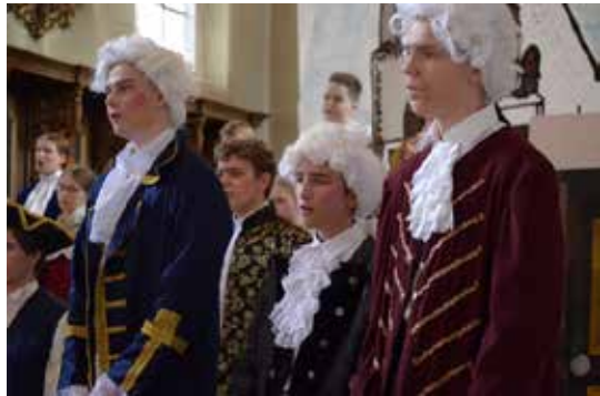
St. Jacobikirche Osterode